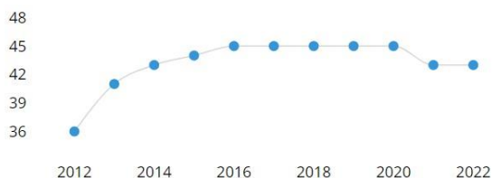
Fig.3: Evolución del nivel de corrupción en Senegal, 2012-2022. Índice de Corrupción 2021 (Transparencia Internacional, 2021).